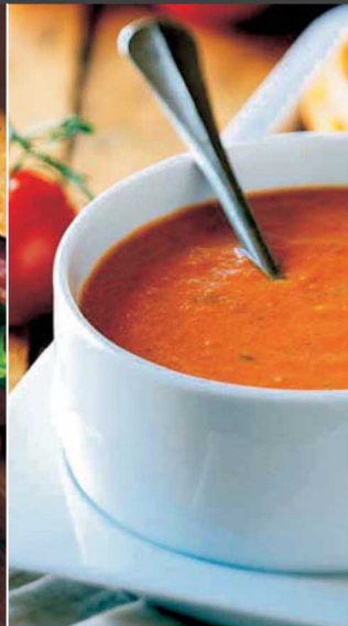
SUPE I POTAŽI